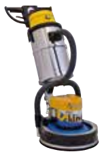
KIT ASPIRAZIONE COMPLETO