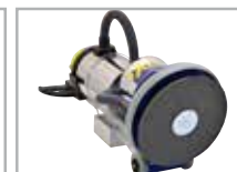
Carta vetrata doppia