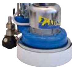
KIT ASPIRAZIONE per Levigatore e Timba.