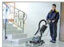
Discolux 20" per lucidatura con Tornado

► Monospazzola per lucidatura ad alta velocità e per vetrificazione e manutenzione su pavimenti in cemento, linoleum, pvc, gomma, sughero, ecc. Dotata di sistema integrato di aspirazione delle polveri per le lavorazioni a secco. Tornado è una macchina che garantisce elevata produttività. Riduce i costi di manodopera del 60%. Rende lucidi i pavimenti. Con Motore da 4hp è la monospazzola ad alta velocità per "Spray-Buffering" e "Spray-Cleaning" più potente al mondo. Ora anche con dischi King Conc per la levigatura e lucidatura dei pavimenti in cemento. *Tornado Basic: Senza aspirazione. *Tornado Cpl: Completa di aspirazione.