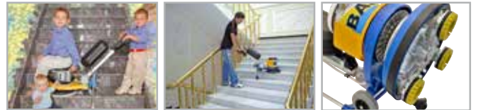
Anche con Planetario

Monospazzola compatta e leggera studiata per la lucidatura di scale, pianerottoli e spazi stretti. Le ruote a sfera, con regolazione indipendente dell'altezza, permettono di poggiarla comodamente su qualsiasi scala. Utilizza a scelta il disco trascinatore e spazzole 330mm o 280mm. Il potente motore da 1,7 HP permette alla Baby di utilizzare anche il PLANETARIO K1000/800 CLASSIC.