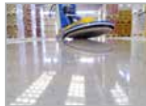
Discolux 28" Per lucidatura con Hurrikane

► Dotata di potente motore elettrico 10 Hp è la macchina ideale per la levigatura e lucidatura di grandi superfici. Facile da utilizzare. Alcuni dei numerosi vantaggi rispetto alle macchine a propano sono: Facile da avviare, semplicemente collegandola alla rete elettrica. Non necessita "l'acquisto e il trasporto del propano". Nessun problema di normative della "sicurezza". Autonomia illimitata. In molti paesi le "macchine a propano" non sono autorizzate per uso interno. HURRIKANE può essere utilizzata in tutto il mondo sia all'aperto che al chiuso. Nessun problema di lavorare in qualsiasi altitudine a differenza delle macchine a propano. Non ha bisogno di ADR per il trasporto.