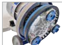
Planetario K1000 Classic incluso Pesì extra optional

► Kroma Grinder è una lucidatrice sviluppata appositamente per il ripristino, levigatura e lucidatura di marmo e terrazzo. Grazie al Planetario, Kroma Grinder è la scelta migliore per gli appaltatori professionali e non. Può essere utilizzata sia come una monospazzola 17", sia come una levigatrice professionale con planetario a ingranaggi. Grazie al motore 4Hp e al robusto riduttore si afferma come monospazzola più professionale e polivalente nel mercato. • Robusta: carcassa in alluminio pressofuso. • Potente motore: 4 Hp con due condensatori per avviamento facile. • Elevata coppia: riduttore con 3 satelliti progettati per lavori pesanti. • Ergonomia: manico regolabile con impugnatura di grandi dimensioni. • Planetario incluso.