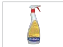
Emme 2000 Spray-Cleaning da usare con monospazzole ad alta velocità e disco rosso.