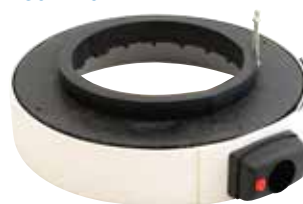
CAPPA ASPIRANTE PER TRASCINATORE