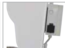
Presà supplementare 220V Inclusa