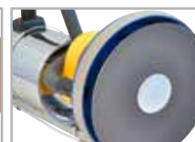
Carta vetrata doppia

Monospazzola professionale con aspirazione integrata per carteggiare e ripristinare parquet prefinito.